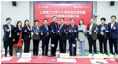
MBA校友理事会换届大会