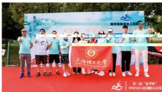
中国皮划艇友谊赛