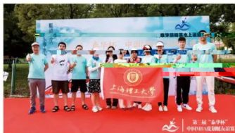
中国皮划艇友谊赛