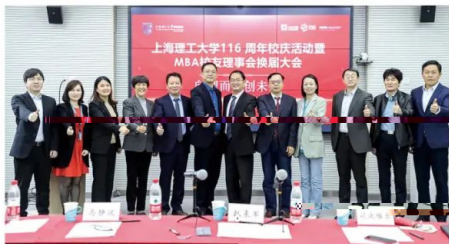
MBA校友理事会换届大会