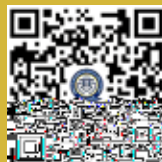
上海财经大学 MBA 订阅号

地址 >> 上海市中山北一路 369 号 邮编 >> 200083 电话 >> 021-65580018 网址 >> http://cob.sufe.edu.cn/MBA 邮箱 >> cobadmissions@mail.sufe.edu.cn 微信 >> 上海财经大学 MBA