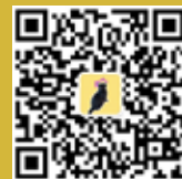
上财 MBA 招生办咨询微信号