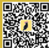
上财 MBA 招生办咨询微信号